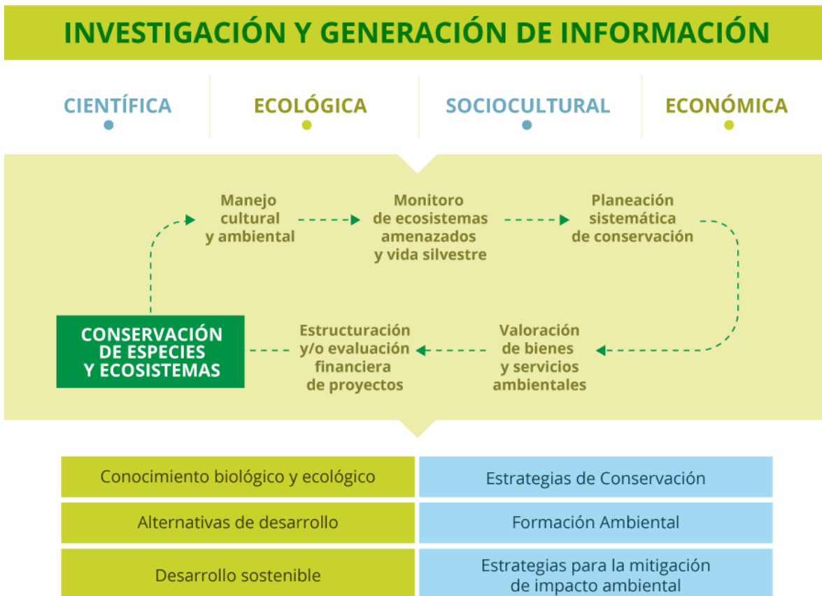
Figura 1. Esquema de trabajo fundación ProCAT Colombia

La estructura operativa y administrativa que se tiene en el Proyecto busca cumplir con los objetivos de la fundación, asignando las funciones dependiendo de las capacidades de los distintos integrantes de ProCAT Colombia y generando un modelo de trabajo en el cual se articulen la investigación con los diversos actores que influyen en la conservación de las especies y los ecosistemas del país (Figura 1).